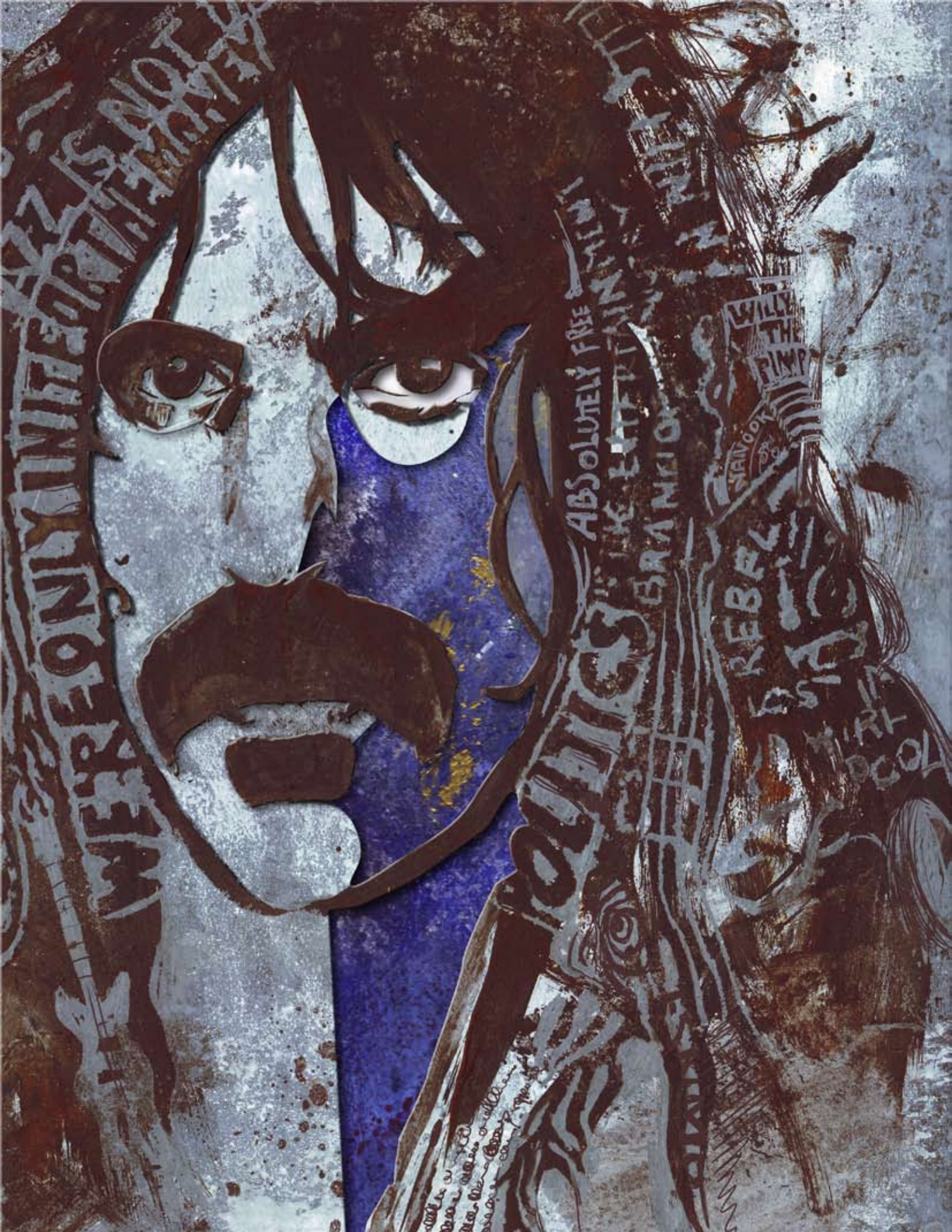
Frank Zappa I (Rost auf Metall, digital nachbearbeitet)

Aussage: auf verschiedenen Ebenen denkend, unkonventionell, vielschichtig, Collage (wie in seiner Musik), Experimentierfreude