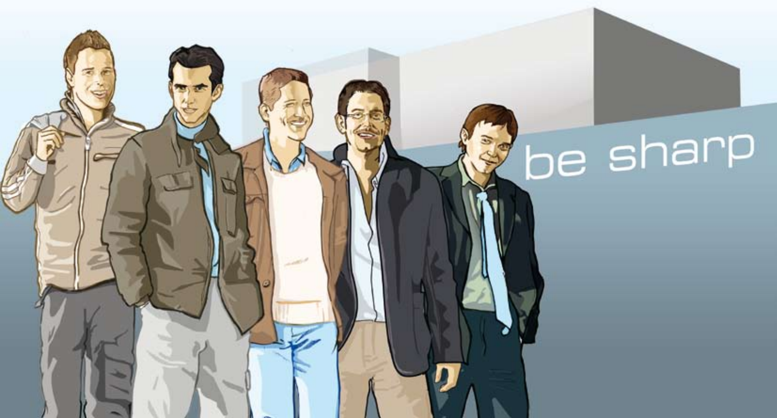
Be Sharp (Tuschezeichnung, digital koloriert)

Nüchterne Art der Illustration, sollte zur Nüchternheit der abgebildeten Person passen