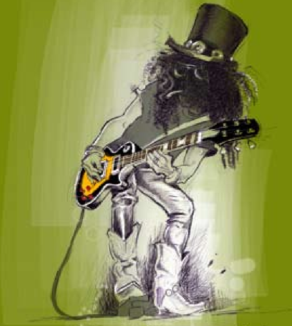
Regina wetter 2008 - www.regina-wetter.de