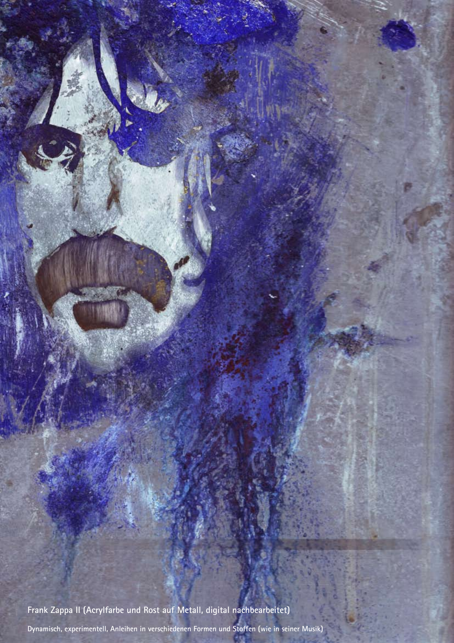
Frank Zappa II (Acrylfarbe und Rost auf Metall, digital nachbearbeitet)

Dynamisch, experimentell, Anleihen in verschiedenen Formen und Stoffen (wie in seiner Musik)