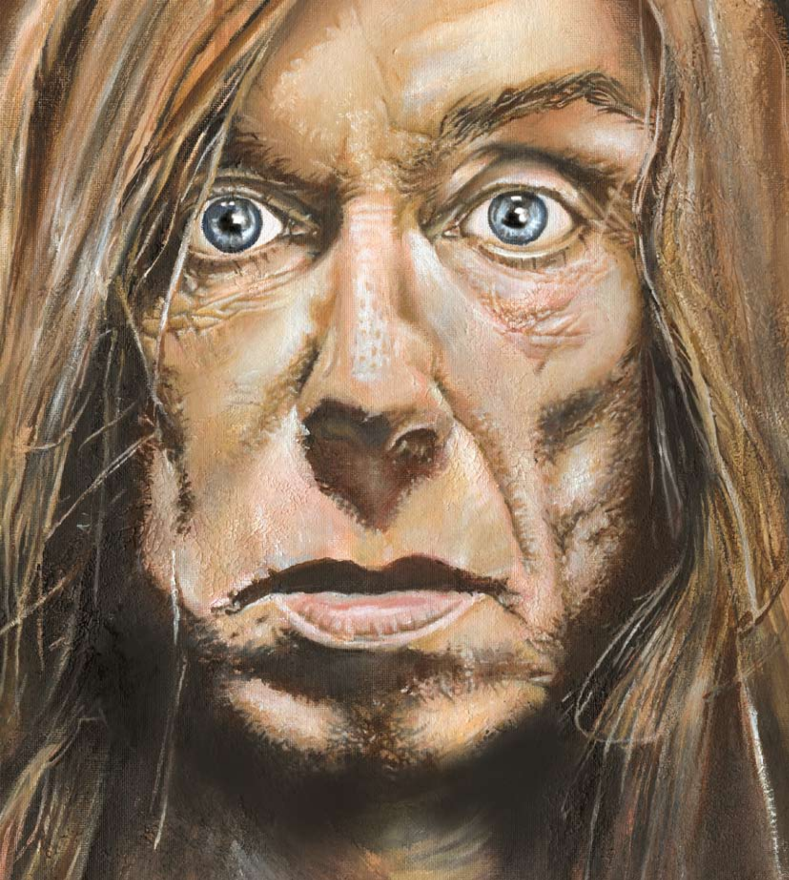
Iggy Pop (Öl auf Leinwand)

Realistische Maltechnik. Diese Augen vergisst man so schnell nicht wieder